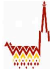
Domkapitel zu St. Stephan